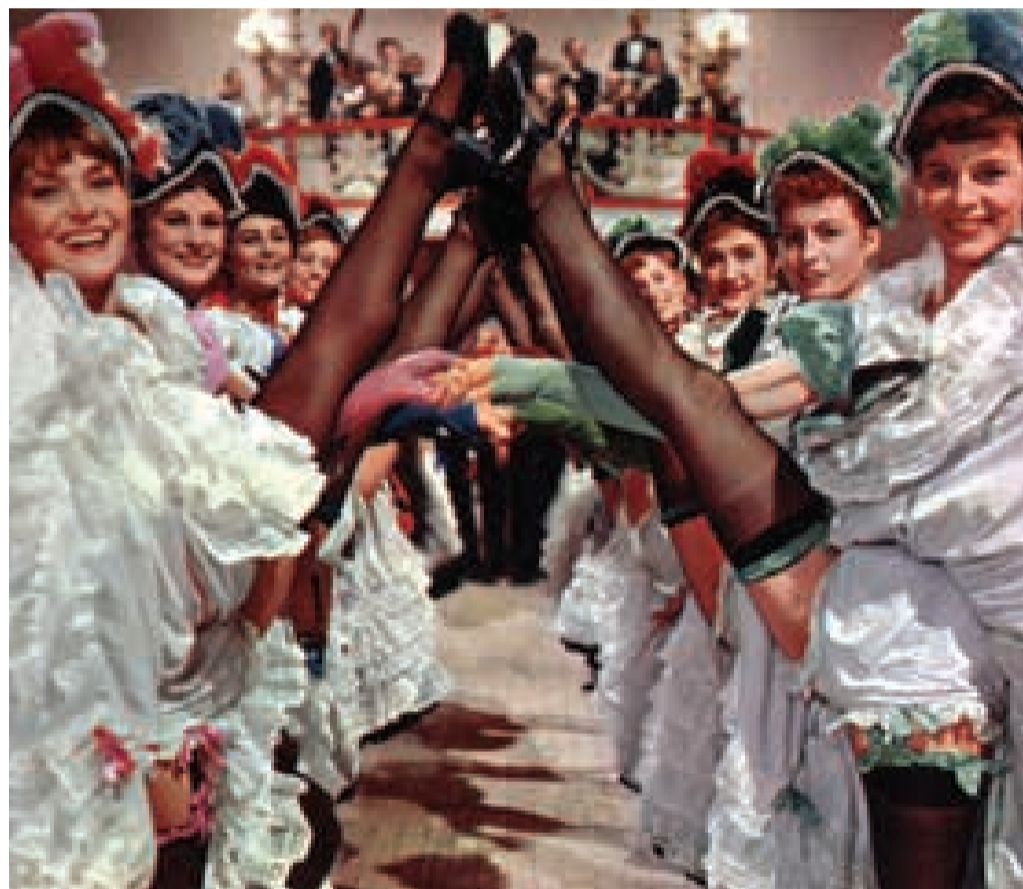
O cartaz inclui clássicos com “Sunrise: A Song of Two Humans”, um filme de 1927 de F. W. Murnau, “French Cancan”, marco dos musicais europeus de autoria de Jean Renoir e lançado em 1955 e “The Docks of New York”, de Josef von Sternberg, película de 1928

York e Joel Grey no elenco, marcou a primeira performance musical de Minelli no grande ecrã.