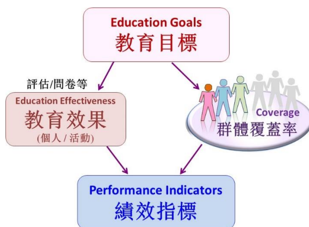
图三：书院教育绩效量度框架

对于一个学生群体，某一教育目标的 绩效指标 则是教育效果和覆盖率的乘积（图三），其数值介乎 0 与 5 之间。这个定义方便我们比较不同时段，不同学生群体，或不同教育目标的实施状况。当然，这个指标也忽略了书院落实不同教育目标时，在深度和广度的差异。书院定期量度教育效果（深度）和覆盖率（广度），然后可以对症下药，审视并调整教育策略和活动项目。